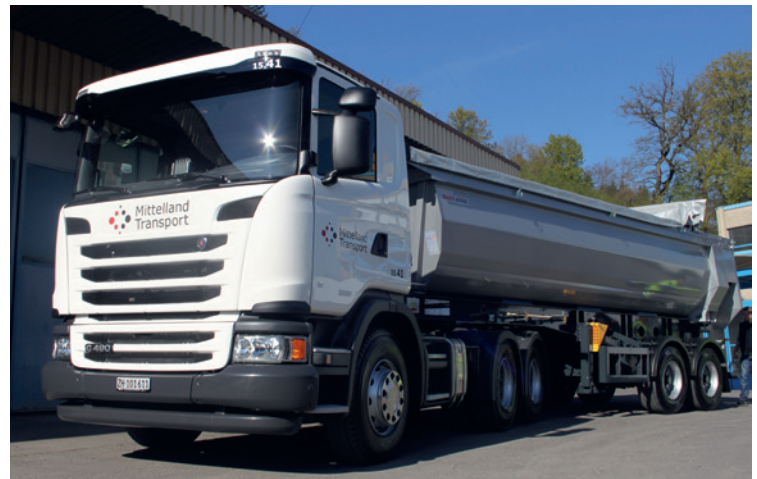
In der Schweiz unterwegs für Jura Materials und andere Kunden aus der Baubranche