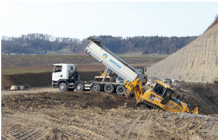
Mittelland Transport ist der Spezialist für Kies, Aushub, Beton und Belagsmaterial