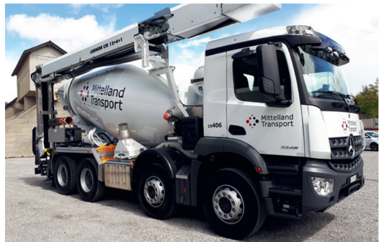
Aktuell sind 160 Fahrzeuge im Einsatz – plus 150 zusätzliche in Spitzenzeiten

Entstanden ist mit Mittelland Transport das größte Nahverkehrstransportunternehmen, das mit knapp 160 Fahrzeugen und 205 Mitarbeitern auf den Straßen der Schweiz unterwegs ist, um Kies, Beton, Aushub und Belagsmaterial zu disponieren und zu transportieren. „Die Transportlogistik sowie das vor- und nachgelagerte Baugewerbe gehörten nicht zur Kernkompetenz von Jura Materials, sodass der Schritt des Outsourcings neues Wachstum und neue Synergien in diesem Segment versprach. Die Mittelland Transport AG hat sich dazu Partner an Bord geholt, die