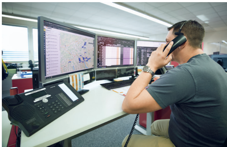
Fachkundige Disponenten nehmen die Aufträge entgegen und beraten den Kunden